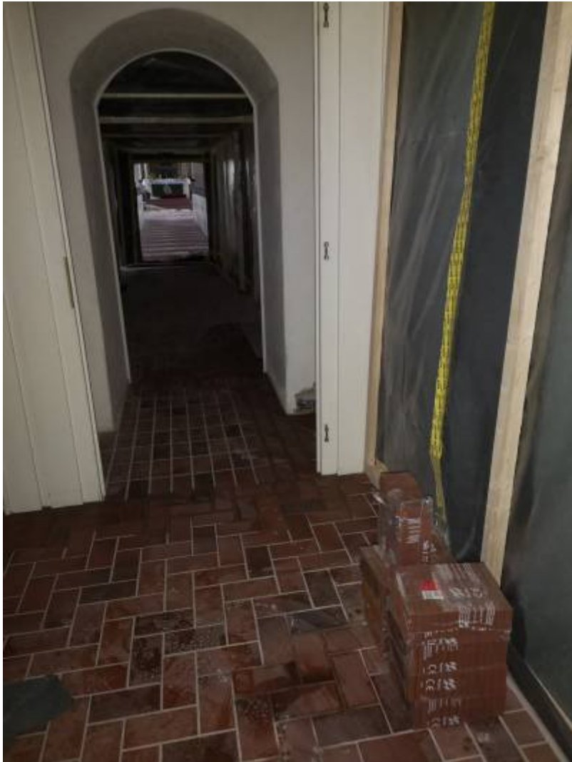
5. Februar abends: Die ersten Fliesen im Kirchenschiff sind verlegt, auch der Rahmen für den Revisionschacht zum Luftkanal ist schon eingebaut.